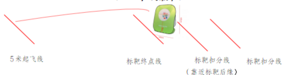
图：弹射飞机赛场地示意图